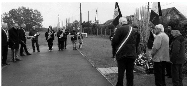
29 avril : la cérémonie du souvenir des déportés au stade Hubert Parent.