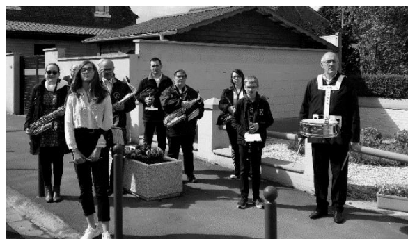
1 er mai