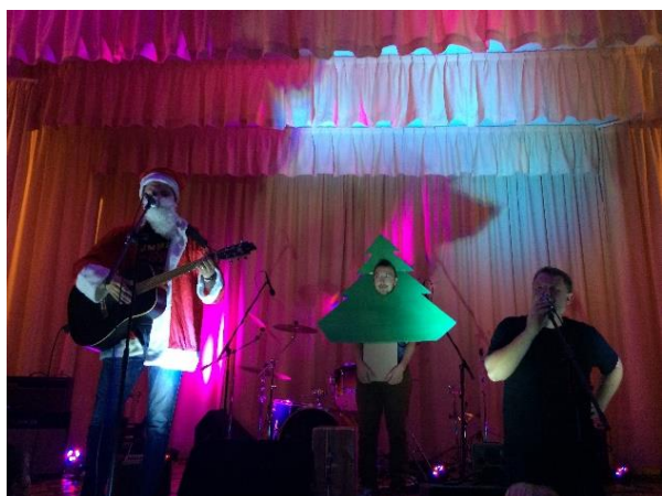
Poubelle Ma Vie

Le public venu en nombre s'est divertie au son de "Poubelle Ma Vie " "Abylen" et "the Electric Co".