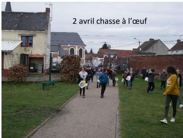
2 avril chasse à l'œuf