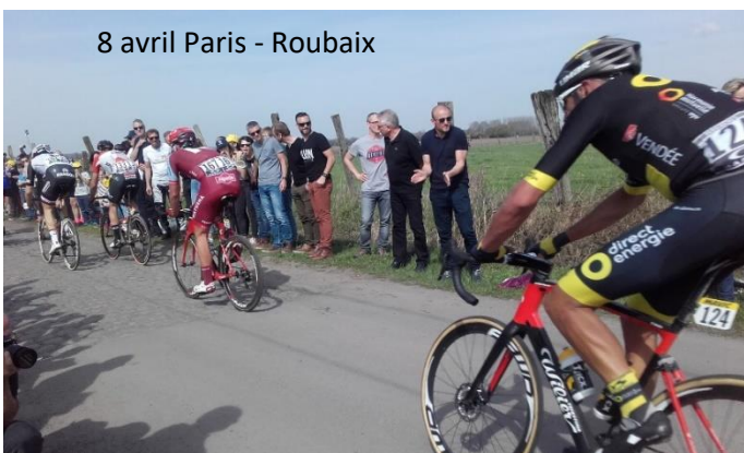
8 avril Paris - Roubaix