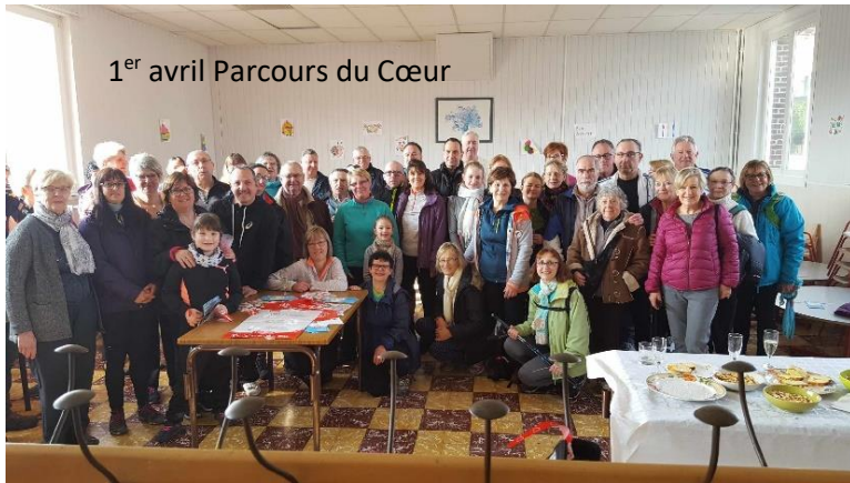
1 er avril Parcours du Cœur