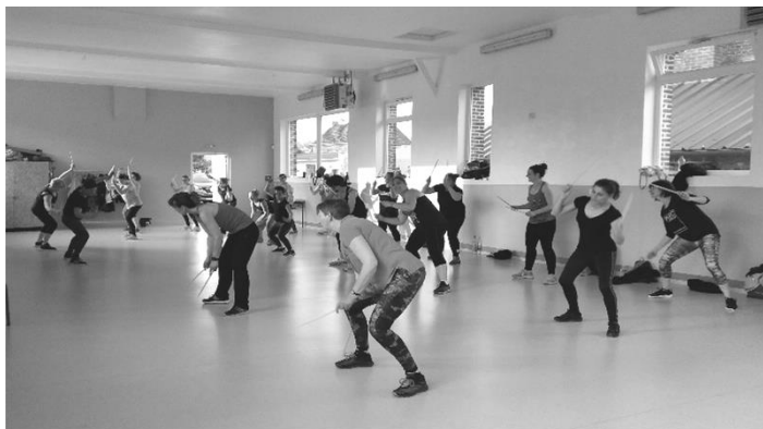
Séance de pound

Des affiches vous informeront sur les dates de ces séances ponctuelles. Vous les trouverez également sur la page Facebook de l'association.