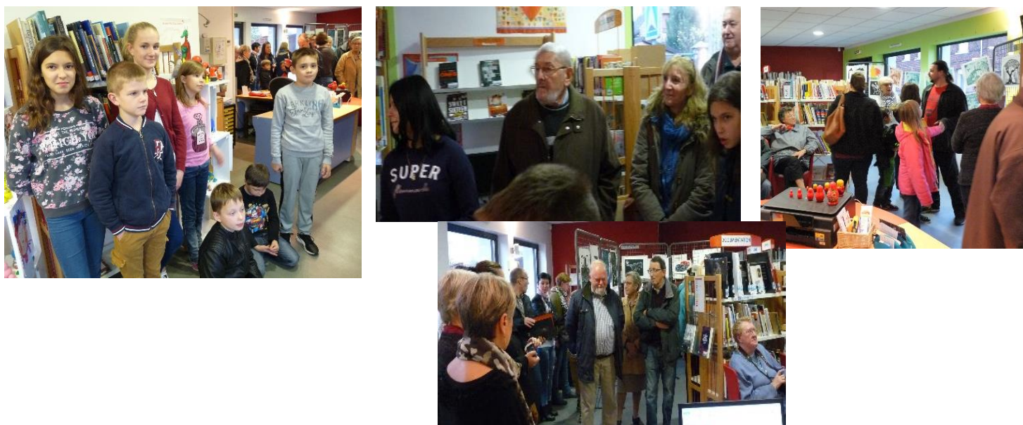
jeunes artistes lors du vernissage

Les gravures réalisées par les habitants et les matriochkas ont été exposées pendant toute la durée du festival "Lire en Ostrevent" organisé par la Communauté de Communes Cœur d' Ostrevent.