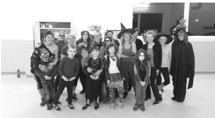
Séance de zumba spécial Halloween