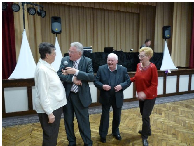
11 février : repas des Aînés