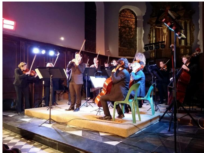
Orchestre de DOUAI Eglise Saint Martin